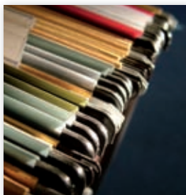
Datenschutzmissachtung kann den Praxisverkauf gefährden.

Bei dem Verkauf oder der Übernahme von Arztpraxen dürfen Patientenakten nur mit der Einwilligung der Patienten an den neuen Eigentümer übergehen. Ist die Kartei dennoch Teil des Übergabevertrags, macht sich der Vorgänger strafbar, da er gegen die ärztliche Schweigepflicht verstößt. Als Folge kann der gesamte Übernahmevertrag zwischen den Ärzten unwirksam werden (BGH, Az: VIII ZR 25/94). Auch ein einfaches Informations-