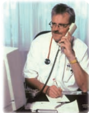
Richter gestatten, dass sich Ärzte im Kittel auf der Homepage zeigen – andere Verbote bleiben bestehen.

Entgegen dem Wortlaut des Heilmittelwerbegesetzes (HWG) hält der BGH das Verbot nur dann für wirksam, wenn die Werbung geeignet ist, den Patienten unsachlich zu beeinflussen und ihn dadurch mittelbar in seiner Gesundheit zu gefährden. Der BGH folgt damit dem Trend zur Wettbewerbsöffnung in der höchstgerichtlichen Rechtsprechung, insbesondere geprägt vom Bundesverfassungsgericht. „Der Gesetzgeber sollte sich deshalb motiviert fühlen, die weiteren Werbebeschränkungen im Gesundheitswesen zu überdenken“, sagt